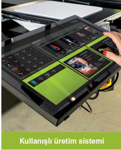
Kullanışlı üretim sistemi