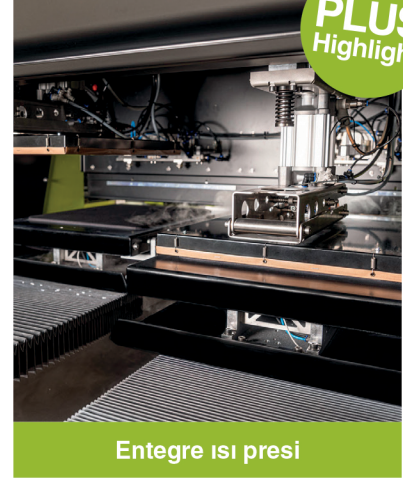
Entegre ısı pres