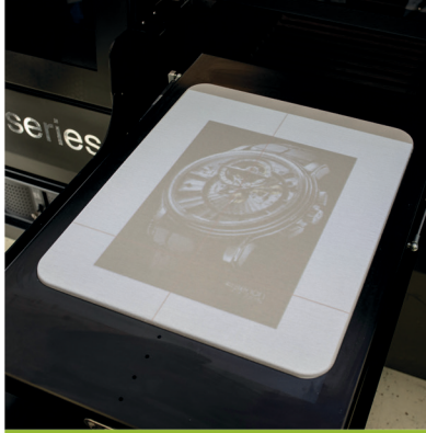
Entegre beamer sistemi