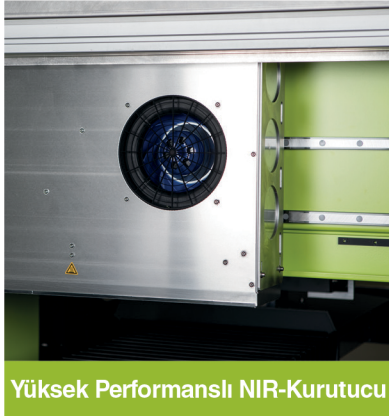
Yüksek Performanslı NIR-Kurutucu